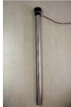
CEM-U6521J (50mm) CEM-U6521K (100mm) CEM-U6521L (200mm)