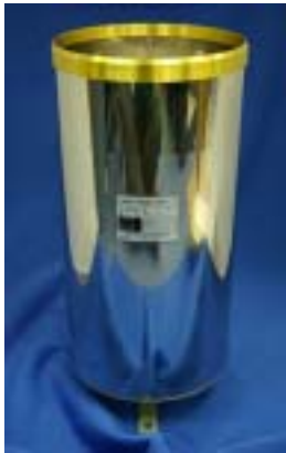
転倒ます式雨量計