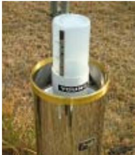
雨量計にセットした状況